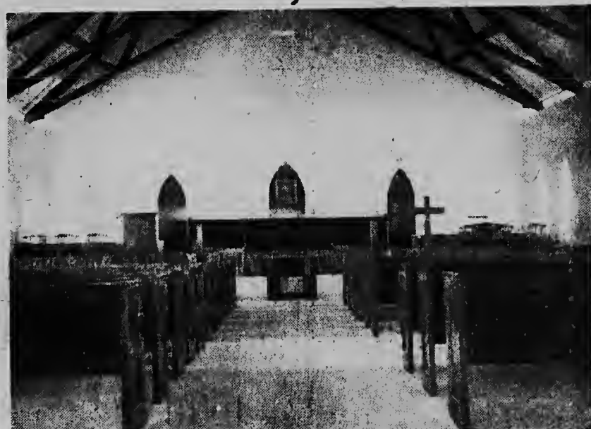
Het interieur van de kerk is al even smaakvol als het exterieur.